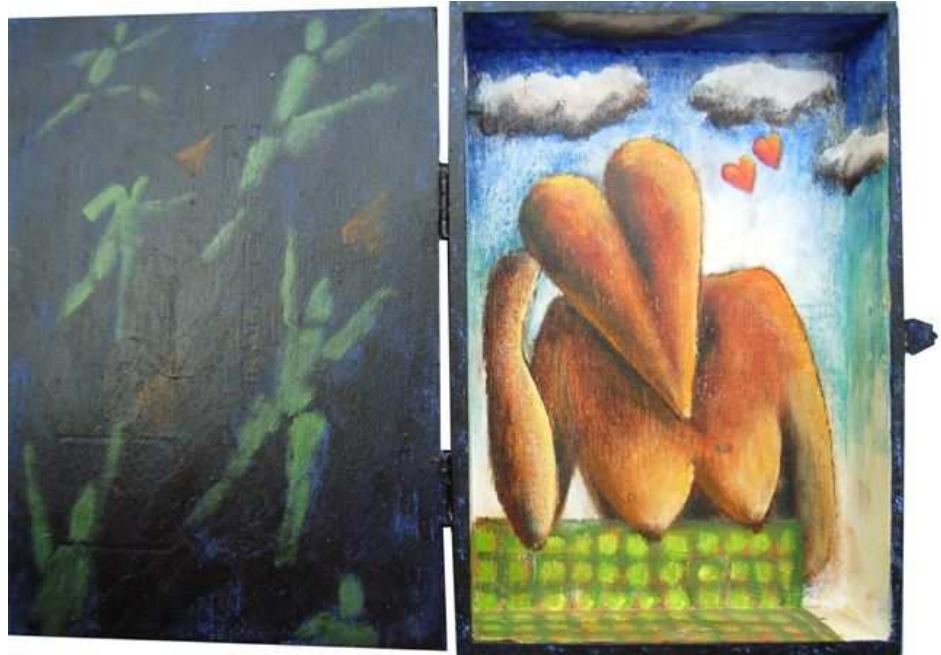
Acryl op kistje 17 x 11,5 cm x 3 cm

Zij werd opgeleid aan de Academie voor Beeldende Kunsten in Arnhem, waar voor haar de accenten lagen op grafische vormgeving, algemene techniek en fotografie. Na een lang dienstverband als vormgever bij verschillende uitgeverijen, besloot ze zo'n vijftien jaar geleden zich geheel te wijden aan het vrije werk. Zij werkt met diverse materialen zoals grafiet, inkt, oliepastel, aquarel en – vooral – acryl.