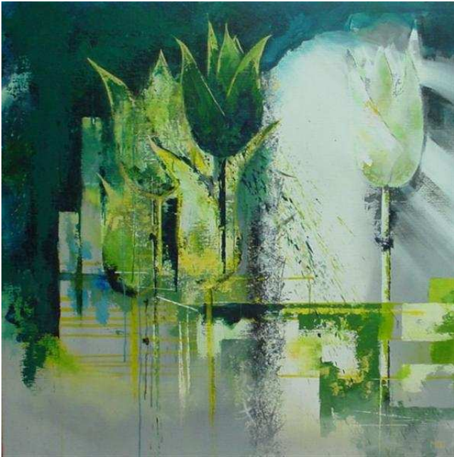
Dageraad, acryl op doek, 100 x 100 cm

Mieke de Rooij (1953), volgde een opleiding aan het Instituut voor Kunstzinnige Vorming in Oosterhout en volgde lessen bij verschillende kunstenaars.