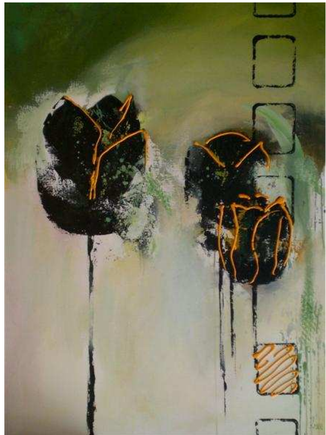
Zwarte tulpen, acryl op doek, 120 x 90 cm

Sinds 2000 exposeert zij regelmatig. Zo waren er exposities in Breda, Ulvenhout, Amsterdam, Heemstede, Dordrecht, Luyksgestel, Oosterhout, Lage Zwaluwe en Beek en Donk.