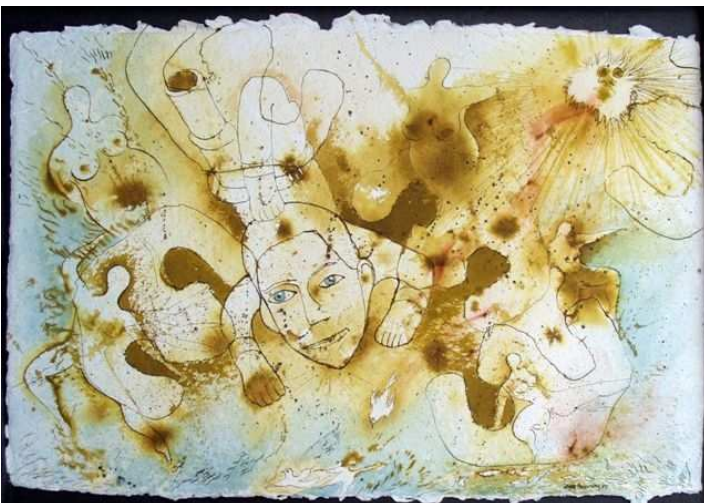
Acrylinkt, 60 x 80 cm

‘Het leven is slechts de aanhoudende verbazing dat ik besta.’ (R. Tagore)