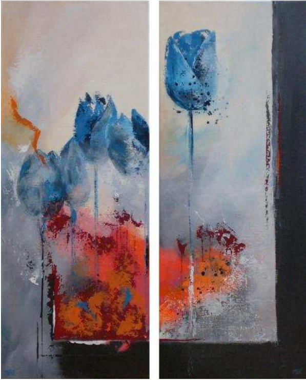
Uitzicht, tweeluik, acryl op doek, 100 x 80 cm