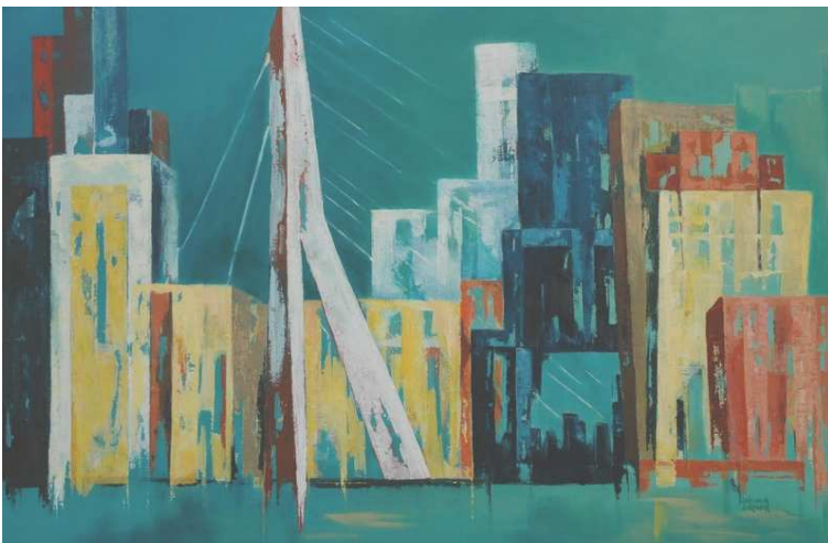
Skyline Rotterdam 2

Vanuit de skylines is zij op zoek gegaan naar een meer abstracte vorm van vlakverdeling.