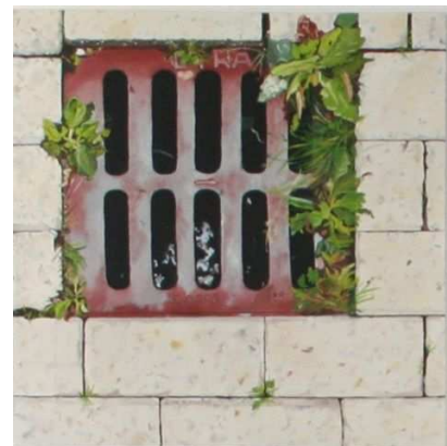
Bielzen en put